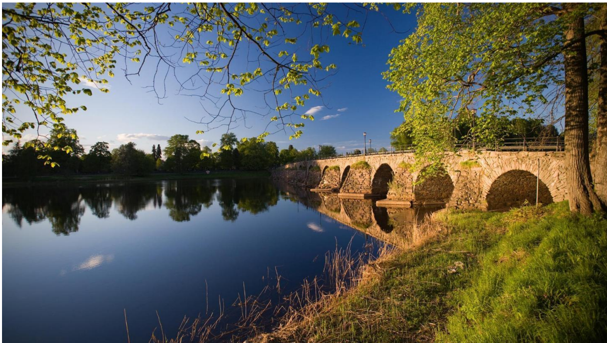
Den gamla stenbron över Klarälven i centrala Karlstad.